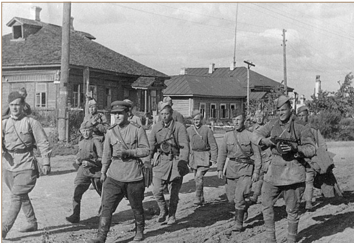
Красноармейцы в городе

13 августа 49-я армия во взаимодействии с соединениями 33-й армии освободили Спас-Деменск. Преодолевая возрастающее сопротивление, советские войска продвинулись на 30-40 км, после чего временно перешли к обороне для подготовки нового прорыва.