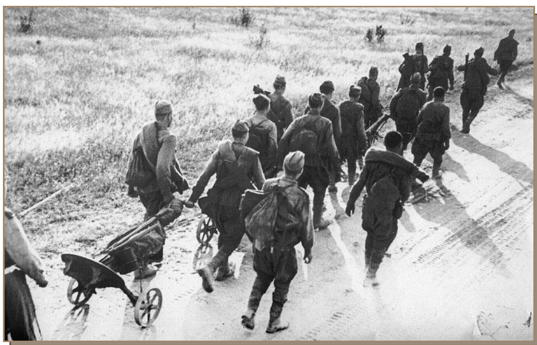
Советская пехота на подступах к Спас-Деменску