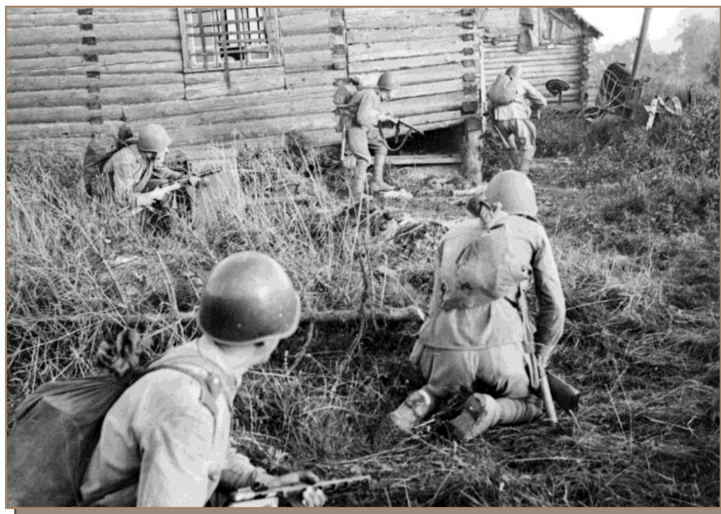
Бой за населенный пункт в районе Спас-Деменска. Август 1943 г.

7 августа перешли в наступление войска 10-й гвардейской и 33-й армий. Противник имел здесь прочную, глубоко эшелонированную оборону. Советским войскам не удалось достичь внезапности, бои за главную полосу обороны противника приняли затяжной характер. Фашисты перебросили к участку прорыва несколько дивизий с Орловского направления. 10 августа севернее Кирова нанесли удар войска 10-й армии и за двое суток продвинулись на глубину до 10 км, охватывая Спас-Деменскую группировку противника с юга. Это вынудило фашистское командование начать 12 августа отвод своих войск с Спас-Деменского выступа.